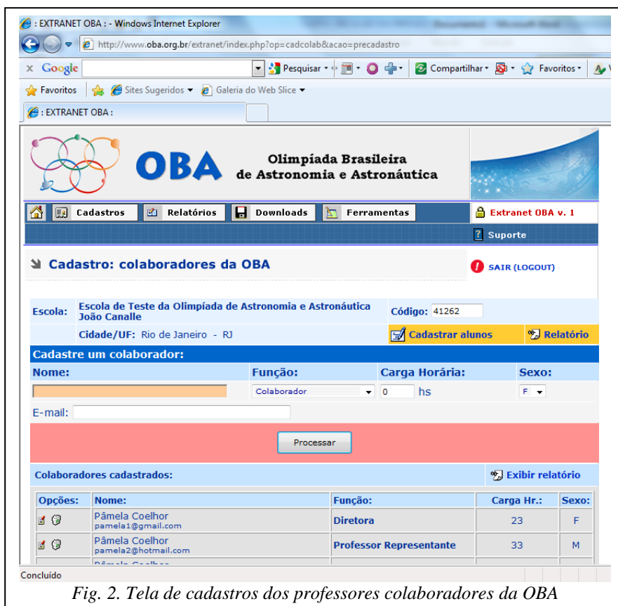
Fig. 2. Tela de cadastros dos professores colaboradores da OBA