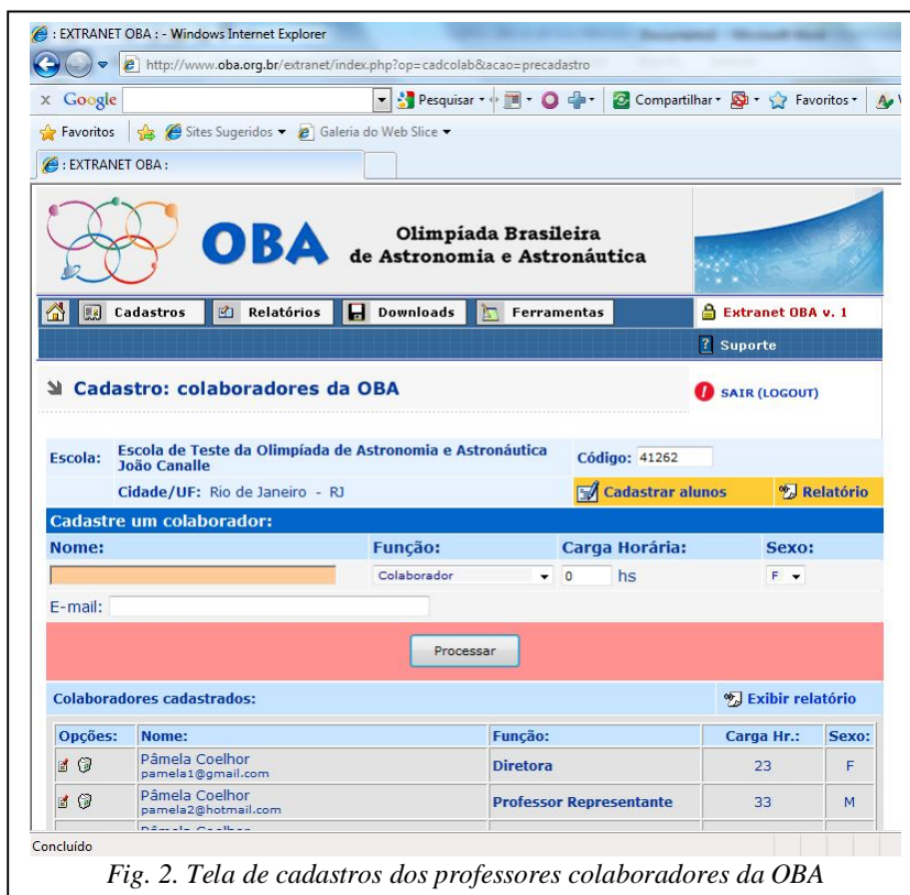
Fig. 2. Tela de cadastros dos professores colaboradores da OBA

Nesta nova tela são mostrados o nome e código da escola, cidade e estado e o campo para digitação do nome do professor representante, do diretor e dos demais colaboradores. Ao digitar o nome (em maiúsculo ou minúsculo, não importa) aperte TAB e irá para o campo FUNÇÃO. Se a pessoa for uma colaboradora, basta apertar o TAB novamente para ir para o campo “carga horária”. Se a pessoa for o diretor da escola basta apertar seta para baixo para selecionar o diretor, ou simplesmente digite D (de diretor) que será selecionada a palavra diretor. Se a pessoa for o professor representante basta selecionar este ou digitar P (de professor representante) para que seja selecionada a função “professor representante”. Não há outra função. Só pode colocar um diretor e um professor representante. Este último nunca pode faltar. A carga horária é opcional e é a carga horária ANUAL gasta com as atividades da OBA daquele ano. O campo sexo funciona como para alunos. Ao digitar o e-mail aperte TAB para ativar o botão PROCESSAR. Em seguida aperte o ENTER para processar a operação. Em seguida receberá uma mensagem de que o cadastro daquele nome foi efetuado com sucesso. A qualquer instante poderá clicar em