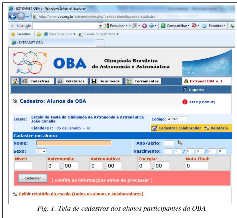
Fig. 1. Tela de cadastros dos alunos participantes da OBA