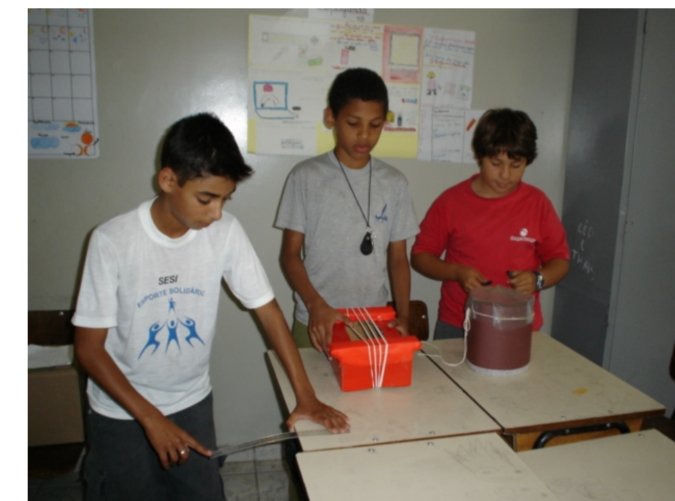
Violão de elástico e tambor