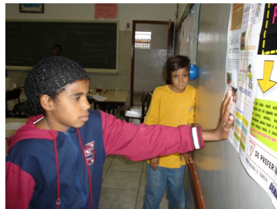
Ouvindo através das paredes