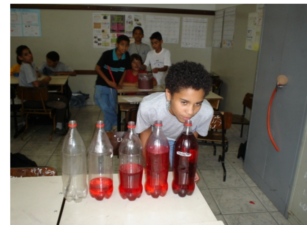
Música de garrafas