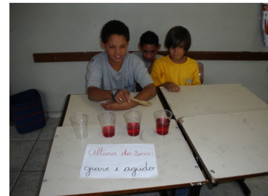
Xilofone de copos