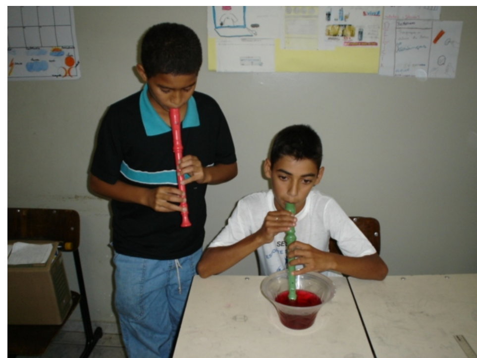
Flauta de baixo da água