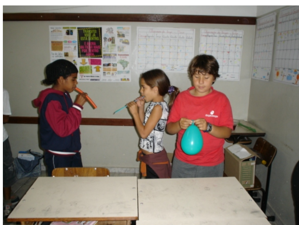
Embocadura e som de bexiga