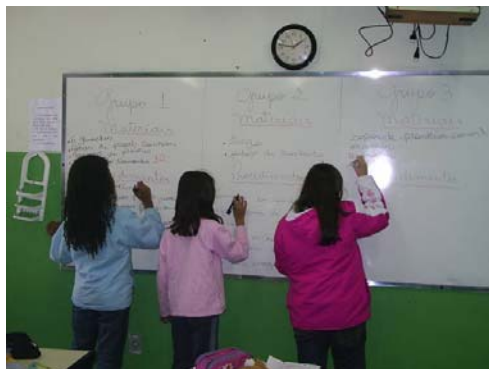
Registro dos grupos-Materiais e Procedimentos