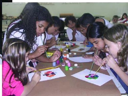
Experimento- Canudinho, Guache e Papel Sulfite