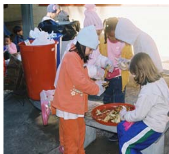
Separando os resíduos orgânicos

3ª Etapa: Utilizando os resíduos- A compostagem.