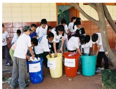
Separando e classificando os resíduos.

2ª Etapa: Organizando, separando e classificando os resíduos.