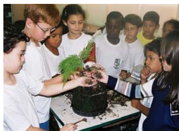
Utilizando os resíduos orgânicos