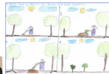
As etapas do processo desenhado pelo aluno