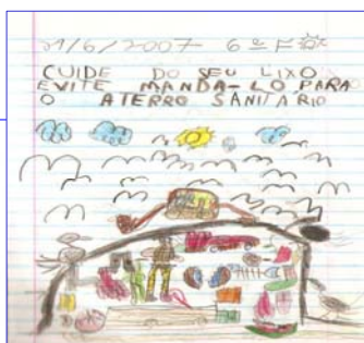
Hipóteses dos alunos