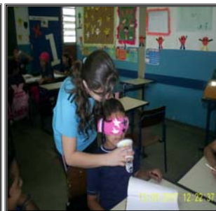
Alunos experimentando o sentido olfato