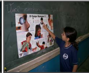
Alunos experimentando os sentidos tato e visão