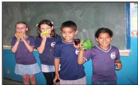
Alunos mostrando os objetos utilizados na atividade "O que é isso"