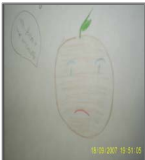
Registro escrito de alunos, tentando explicar ao E.T. o que é uma laranja.