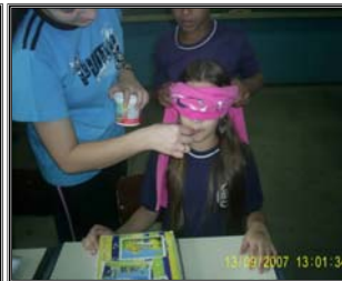
Alunos experimentando o sentido paladar