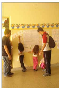
Alunas mostrando o trabalho aos pais.

A lagartixa não cai quando anda no teto porque tem pelinhos nos dedos que fazem ela grudar na parede. Quando a lagartixa quer fugir do inimigo, solta um pedaço do seu rabo. Enquanto o inimigo fica vendo o rabo se mexer, a lagartixa foge. Demora um pouco para nascer um rabo novo. O rabo novo é menor, mais grosso e pode ficar tortinho. A lagartixa come bichinhos que se chamam insetos: mosca, mosquito, borboletinha.. Ela vive nos buracos das pedras, nos lugares úmidos. Dentro da nossa casa, a lagartixa se esconde atrás dos móveis também. A mamãe lagartixa bota ovo pequenininho e branco. Ai nasce um filhotinho com rabinho. A lagartixa parece um jacaré. O inimigo que come a lagartixa é o gato, a cobra, o gambá, a galinha. A lagartixa tem duas patas de cada lado do corpo. Tem cinco dedos com cinco unhas em cada patinha.