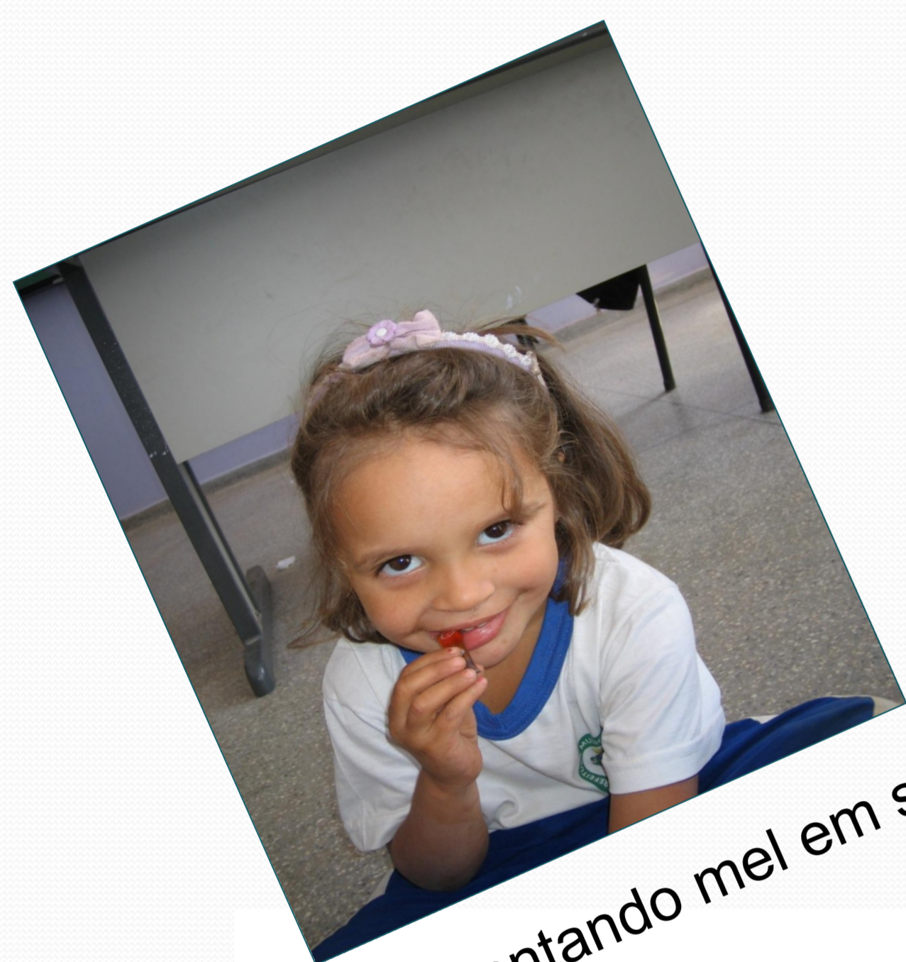
Experimentando mel em sache

O projeto sobre as abelhas, realizado na CEMEI Maria Alice Vaz de Macedo, com crianças de 3 e 4 anos, surgiu da curiosidade dos alunos, após o aparecimento de abelhas no parque. O fato de uma das crianças ser alérgica a picada de abelha também foi um fator que contribuiu para que este tema fosse abordado.