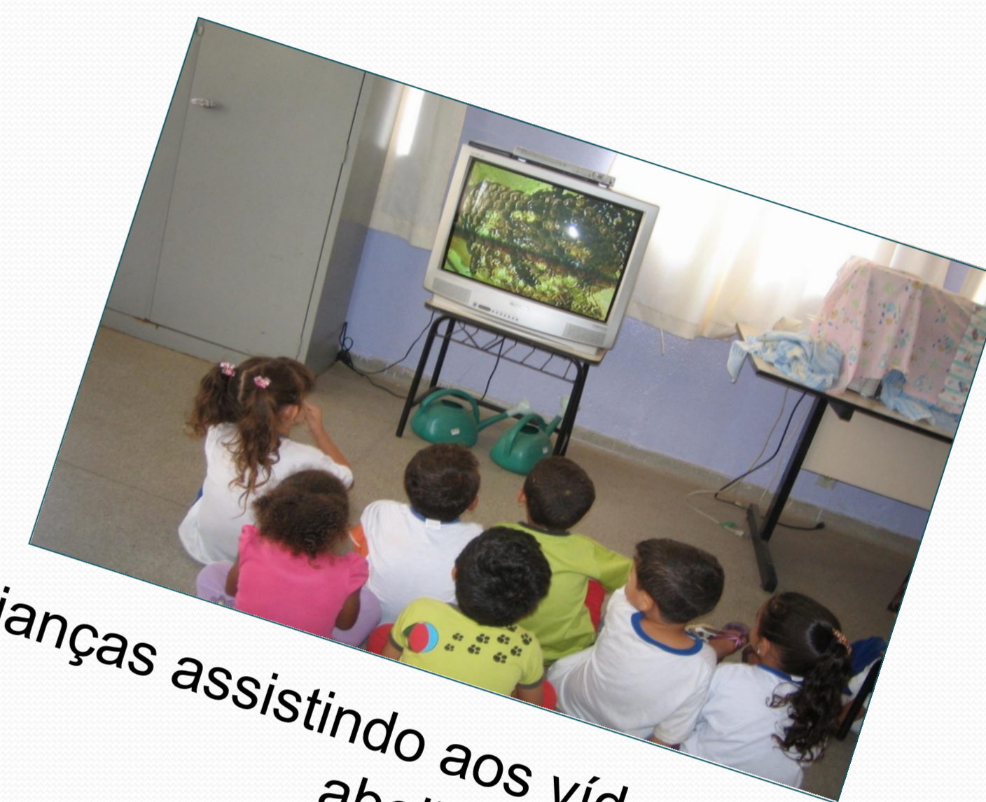
Crianças assistindo aos vídeos sobre as abelhas

O projeto sobre as abelhas, realizado na CEMEI Maria Alice Vaz de Macedo, com crianças de 3 e 4 anos, surgiu da curiosidade dos alunos, após o aparecimento de abelhas no parque. O fato de uma das crianças ser alérgica a picada de abelha também foi um fator que contribuiu para que este tema fosse abordado.