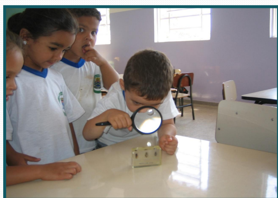
Crianças observando as abelhas com lupa

No final do projeto, observamos que as crianças aprenderam como as abelhas se comportam e que elas picam quando se sentem ameaçadas. Aprenderam também que são elas que fazem o mel.