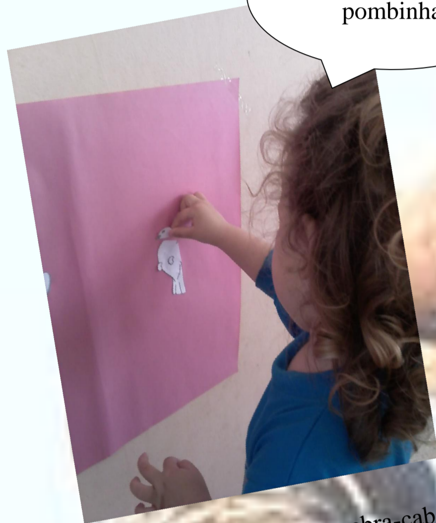
Figura 8 – Montagem do quebra-cabeça (pomba)

O projeto foi desenvolvido no CEMEI Antônio de Lourdes Rondon, numa turma de 25 crianças de fase 3 (2 a 3 anos), no período da manhã.