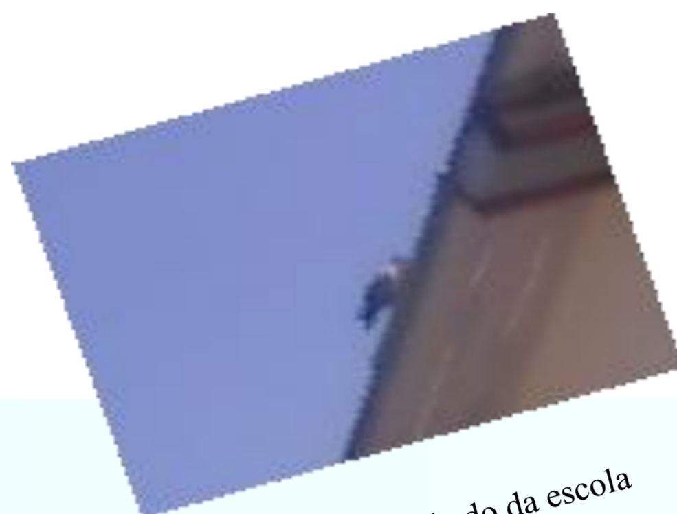
Pomba no telhado da escola