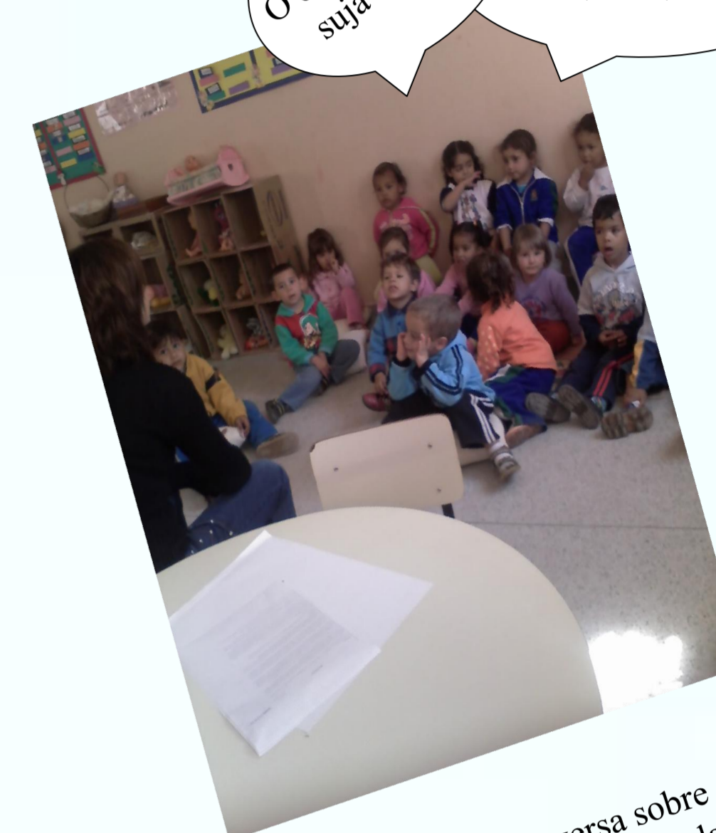
Figura 2 – Roda de conversa sobre a observação das pombas da escola