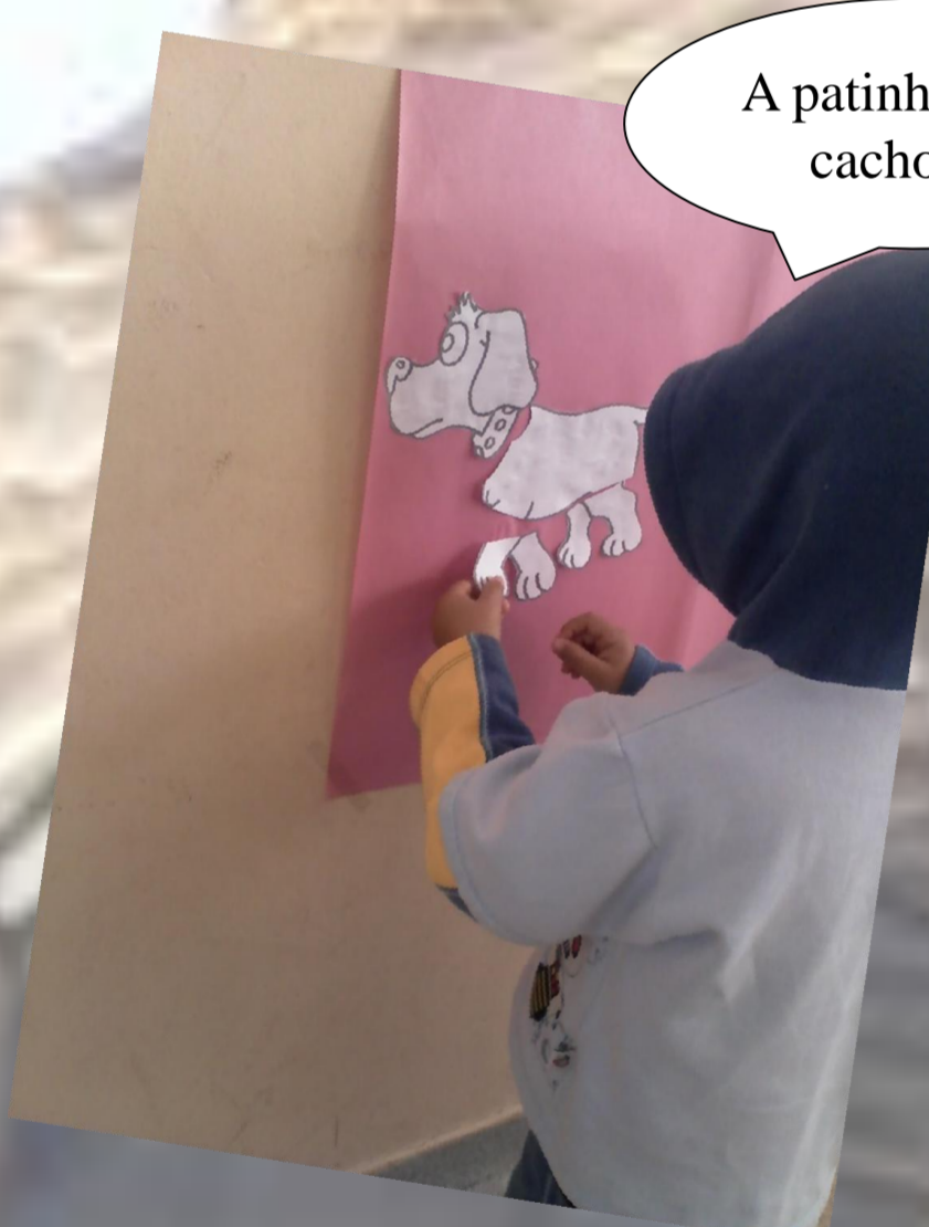
Figura 7 – Montagem do quebra-cabeça (cachorro)