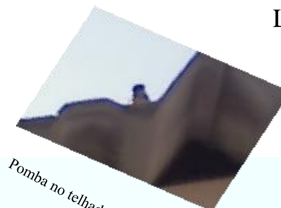
Pomba no telhado da escola