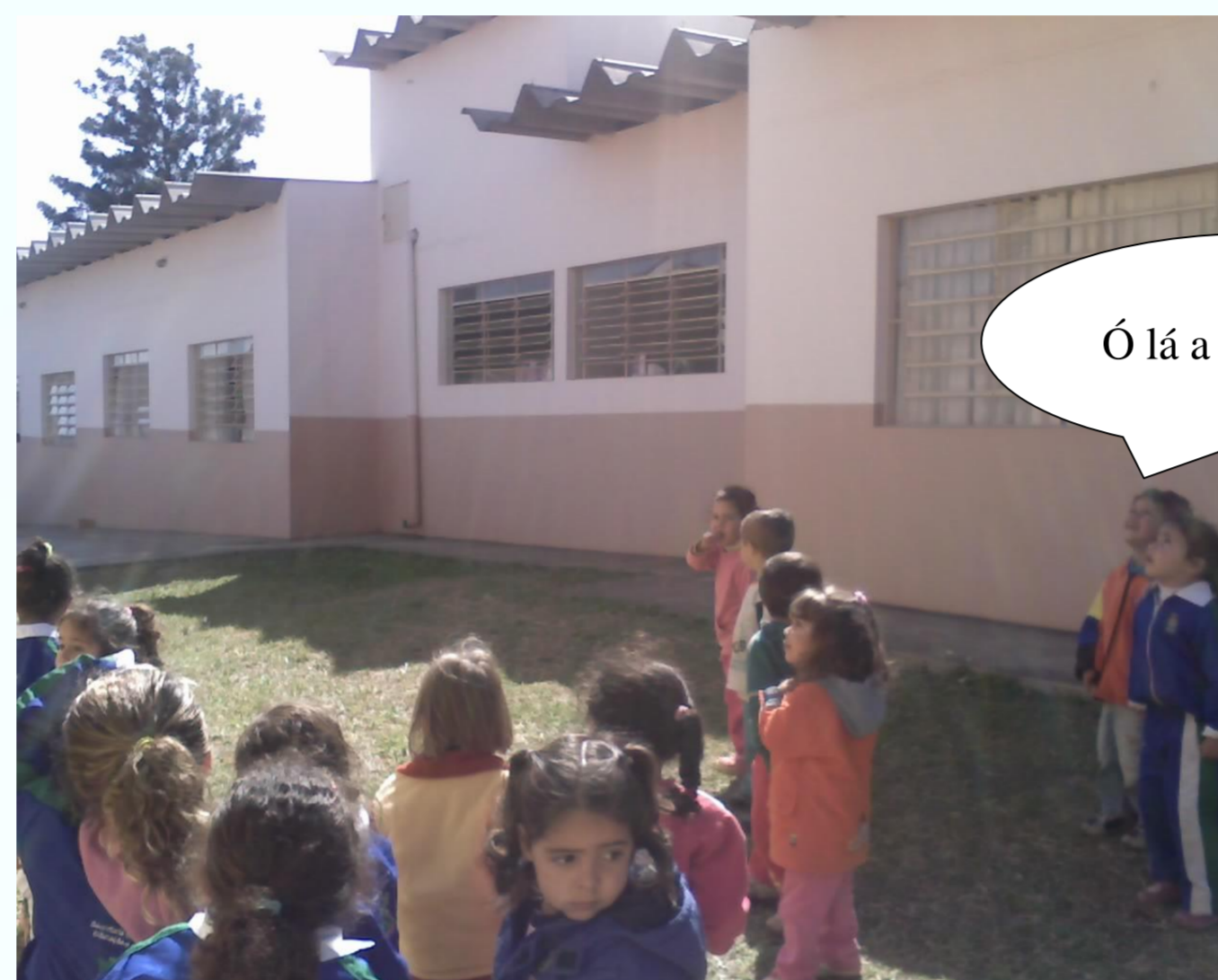
Figura 1 – Passeio pela escola para observação das pombas