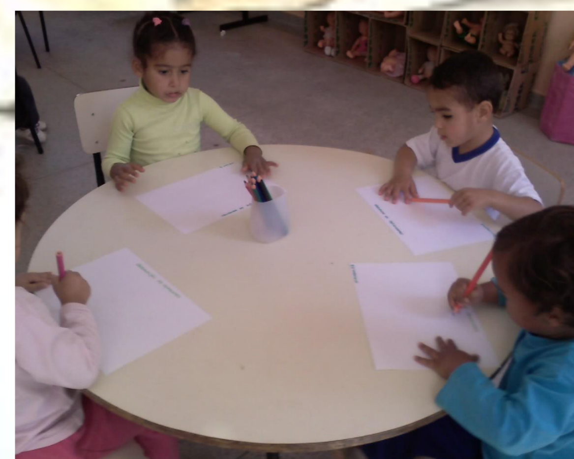
Figura 4 – Registro das crianças