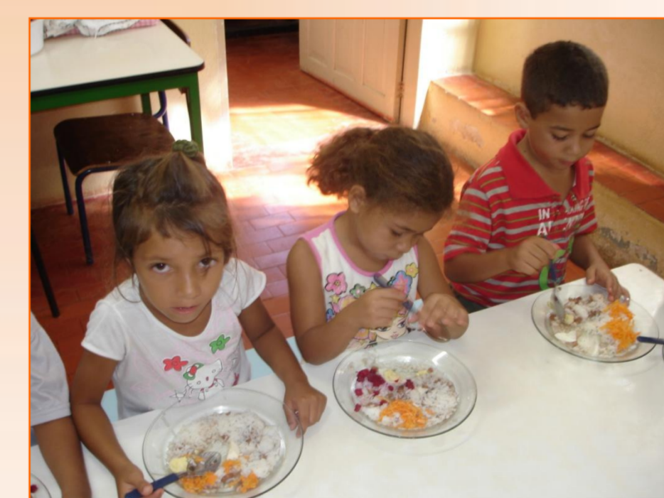
Figura 4– Degustação da salada de cenoura.

Perguntamos o que poderíamos fazer com a cenoura que plantamos. Sugeriram que fizéssemos salada de cenoura ralada e suco de laranja. Na hora do almoço 90% das crianças experimentaram a salada de cenoura e 100% tomaram o suco de laranja com cenoura (figura 4).