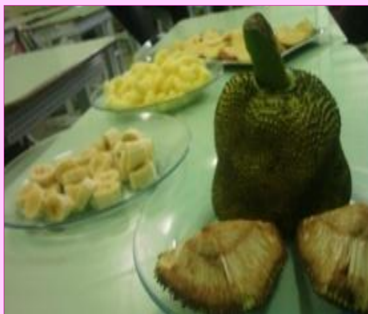
Alimentos oferecidos para os alunos cheirar e saborear