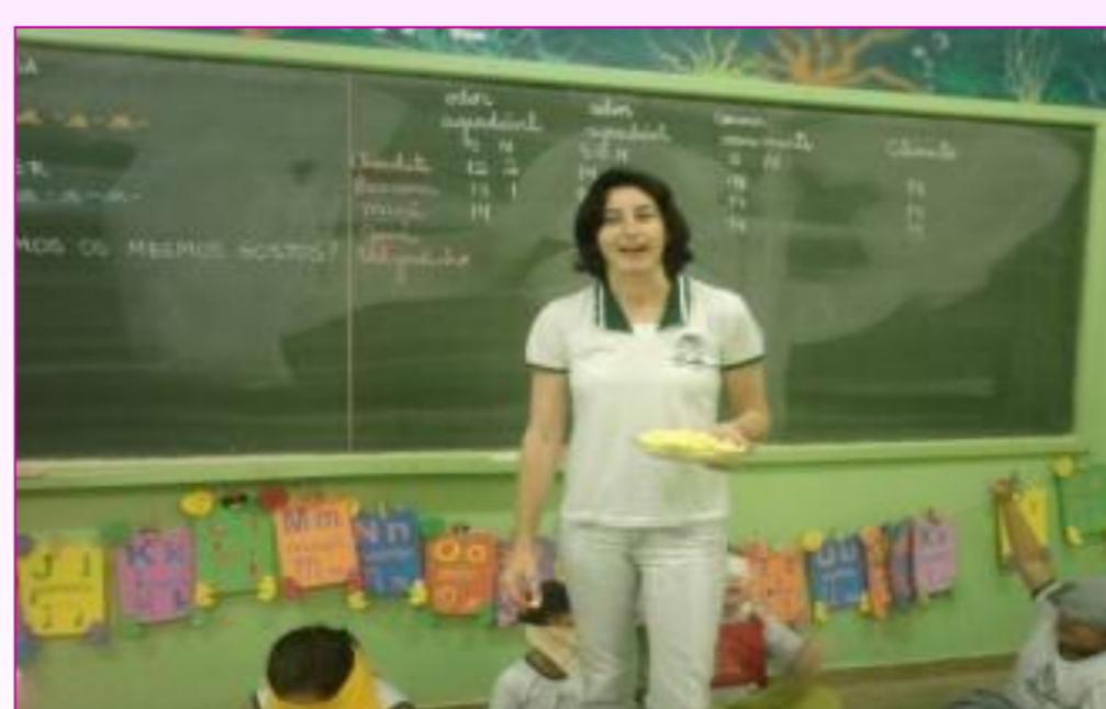
Alunos cheirando e saboreando os alimentos oferecidos